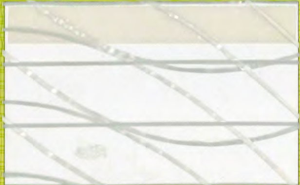
GH6000 (185cm×#6000) 透明・40m 乱