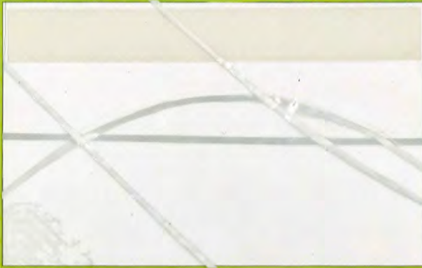
GH3000 (185cm×#3000) 透明・50m 乱