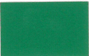
T-07 グリーン [透光率:0.1%]