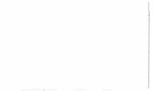
T-18 ホワイト [透光率:4.9%]