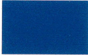
T-01 ロイヤルブルー [透光率:0%]