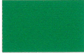
T-09 フォレストグリーン [透光率:0.2%]