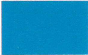
T-02 ライトブルー [透光率:0.1%]