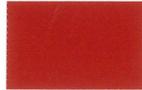
T-13 レッド [透光率:0.7%]