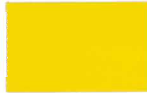
T-11 イエロー [透光率:5.9%]