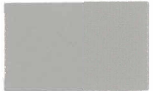
T-19 グレー [透光率:0.4%]