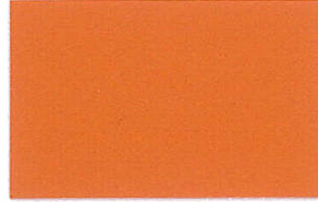
T-12 オレンジ [透光率:2.4%]