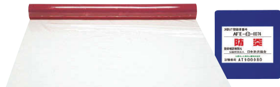
アキレス フラーレ