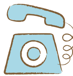
ご来院の前に お電話を！