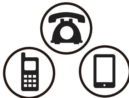
ご来院の前にまず お電話を！